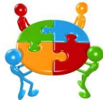
Spirit de echipă